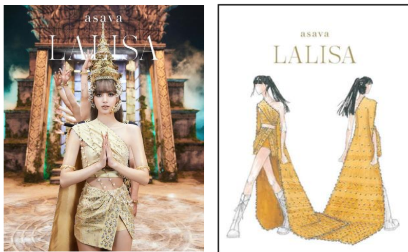
Rajah 3: Rekaan baju lalisa yang diambil daripada laman media sosial, Instagram pereka terkenal Thailand Asava Group

Tambahan, busana tradisional ini juga didatangkan lengkap dengan jubah panjang serta skirt mini berkilauan emas. Busana buatan tangan itu mendapat inspirasi daripada wilayah Lamphun di Thailand dan turut dihiasi kristal Swarovski bagi menonjolkan ciri mewah dan kontemporari apabila dipakai dan dilihat (Mstar 2021). Oleh itu, busana ini jelas mempamerkan ciri-ciri khas terhadap budaya Thailand melalui perincian yang diletakkan oleh pereka busana terhadap baju yang dipakai oleh Lisa dalam muzik videonya ini.