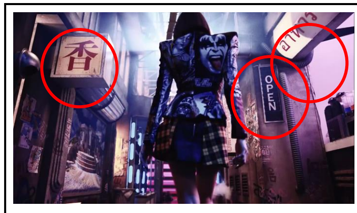
Rajah 4: Penonjolan penggunaan bahasa dalam muzik video 'Lalisa'

Perkara ini turut dikuatkan apabila Lisa kerap kali mengulang ayat ' say, Lalisa love me Lalisa, love me ' dan ' call me, Lalisa, love me, Lalisa, love me ' yang mana 'Lalisa' ini adalah merujuk kepada nama beliau sendiri dan menginginkan agar peminat dan pendengar akan terus mengingati serta menyanyangi beliau dalam apa jua yang dilakukan lebih-lebih lagi terhadap lagu dan karya yang dihasilkan. Namun begitu, pengkaji tidak menjumpai sebarang penggunaan Bahasa Thailand yang dihasilkan dalam lagu 'Lalisa' ini. Perkara ini jelas sekali kerana sasaran kepada lagu 'Lalisa' ini lebih luas bersifat global dan bukan sekadar Korea, Thailand dan Asia disebabkan itu, penggunaan Bahasa Thailand dilihat kurang bersesuaian sebagai lirik kepada lagu ini.