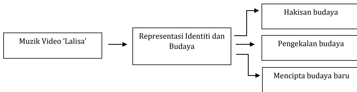
Rajah 1: Kerangka konsep kajian

Elemen pertama menurut Fleur (2016) adalah, teks mahupun mesej komunikasi melalui saluran media dapat memperkuat pola budaya yang ada di sesebuah masyarakat. Seterusnya yang kedua adalah, teks atau mesej komunikasi melalui saluran media ini mampu untuk mencipta pola budaya baru dalam masyarakat namun ianya masih tidak bertentangan dengan budaya asal. Ketiga dan yang terakhir pula ialah media juga mampu untuk menghakis sesebuah kewujudan budaya yang ada.